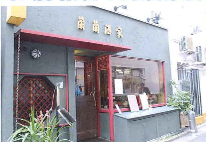
竹ノ内米店のお米を使っています。