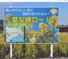
道路脇の黄色い旗が目印です。