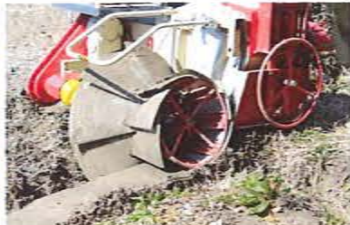
ウラ面もご覧下さい

今年は45年ぶりの大雪の影響もあり、少し遅れ気味ですが、3月後半には、種蒔きも始まりそうです。大雪の年は、豊作と言われています。